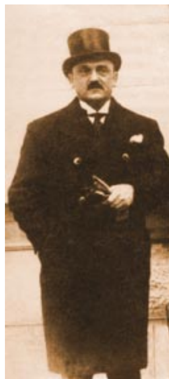
1934. Ο Νίκος Κιτσιόκης, κοσμήτορας, στο Προεδρείο της Γερουσίας

Ε πίσης γίνεται και ειδική αναφορά στο έργο του Νίκου Κιτσιόκη, προέδρου του ΤΕΕ από το 1931 έως το 1935, Καθηγητή και Πρύτανη του ΕΜΠ από το 1916 ως το 1945, Γερουσιαστή από το 1929 ως το 1935, Βουλευτή από το 1956 έως το 1967 και μέλους της Συντακτικής Επιτροπής του Περιοδικού.